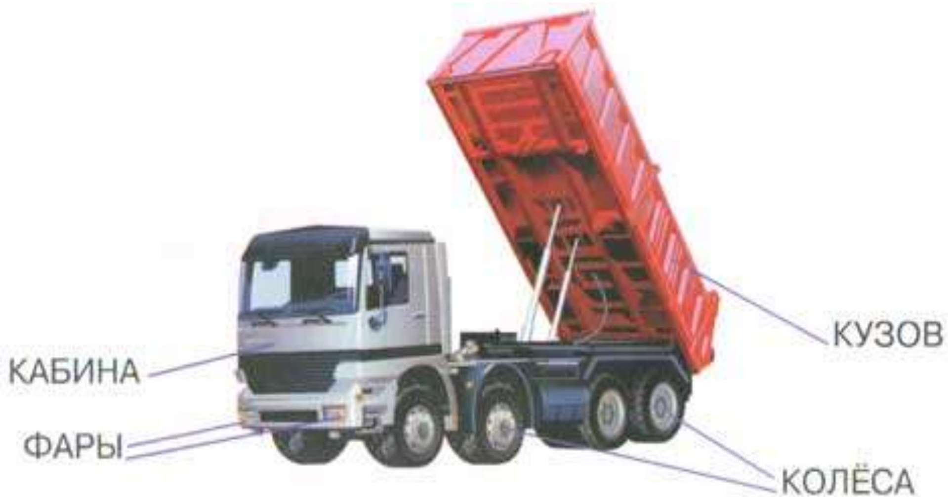
АВТОМОБИЛЬ (ГРУЗОВОЙ): КАБИНА, КУЗОВ, КОЛЁСА, ФАРЫ